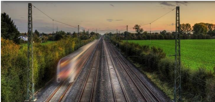
Initiative für erweiterten Mobilitätspakt Rastatt