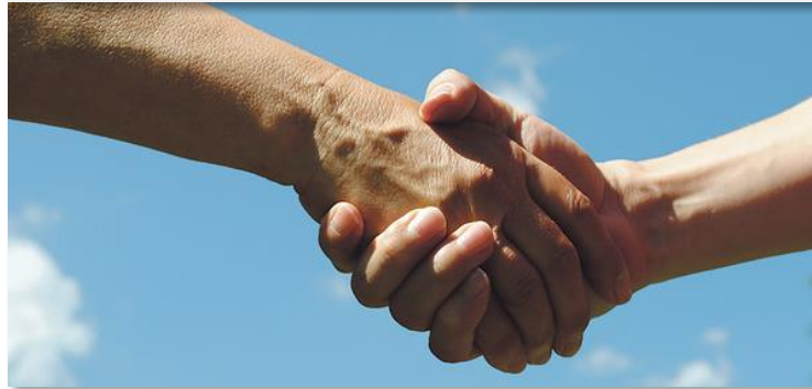
Kooperation mit lokalen Betrieben